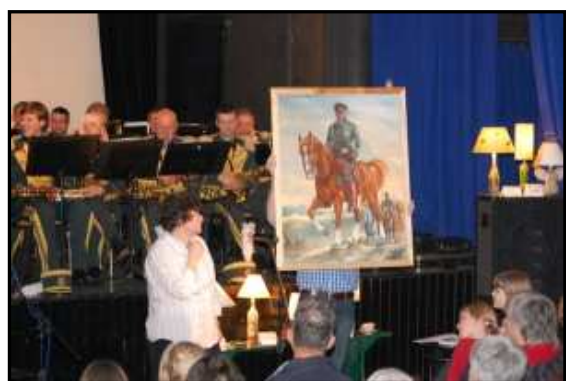
Licytacja cennych darów – m.in. portretu Józefa Piłsudskiego