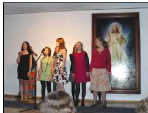
Koncert piosenek Anny Jantar - finał

Ten obfity w wydarzenia dzień zwińczył koncert piosenek Anny Jantar w wykonaniu gimnazjalistek z klasy I i III i według ich pomysłu. Koncert i późniejsza aukcja zgromadziły bardzo liczną publiczność, która dość hojnie otwierała portfele, chcąc zdobyć licytowane dary. Wśród nich znalazła się m.in. piłka siatkowa z podpisami zawodniczek z narodowej drużyny siatkarskiej, czyli popularnych Złotek.