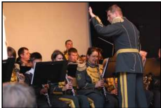
Dyrygent i jego orkiestra