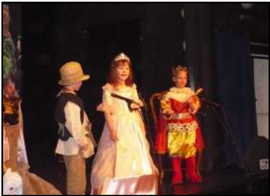
← Teraz Królowna będzie moją żoną!

Jak to zwykle w baśniach bywa – wszystko skończyło się szczęśliwie... →