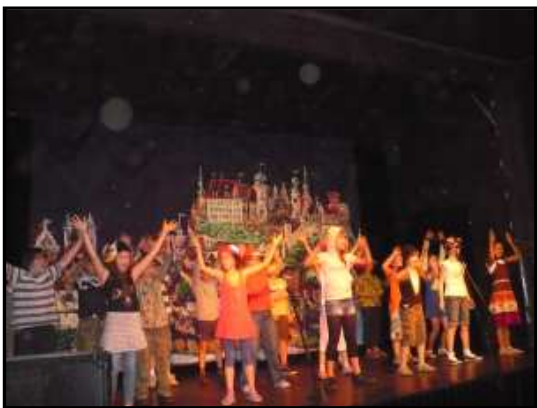
← Wesoły występ klasy 3